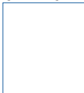
અરજદાર (ભાડે લેનાર)નો ફોટો

હું/અમે સેફ ડિપોઝિટ લોકર સંબંધમાં નિયમો અને શરતો વાંચ્યા, સમજ્યા છે. હું/અમે કથિત નિયમો અને શરતો સાથે બંધાયેલા રહેવા સ્વીકૃત અને સંમત છીએ. હું સંમતિ આપું છું કે બેન્ક લાગુ હોય ત્યારે મારા / અમારા ખાતામાંથી સેવા શુલ્ક વત્તા કર કાપી શકીએ છીએ. હું / અમે અત્રે ઘોષિત કરીએ છીએ કે ઉક્ત વિગતો સાચી છે. ભાડું અને અન્ય શુલ્કનું વર્તમાન શિડ્યુલ મારા / અમારા દ્વારા પ્રાપ્ત થયું છે અને હું/અમે તે સાથે સંમત છીએ. હું/અમે વધું સમજીએ અને સંમત છીએ કે ટેરિફ/ ભાડું/અન્ય શુલ્કમાં ત્યાર પછી કોઈ પણ ફેરફાર બેન્ક દ્વારા તેની વેબસાઈટ અને/ અથવા તેની શાખાનાં નોટિસ બોર્ડ પર પ્રસિદ્ધ કરશે, જે આવા ફેરફાર સંબંધમાં મારા/અમારા દ્વારા પૂરતી સૂચના રહેશે. હું/અમે ઘોષિત કરીએ છીએ કે અમે સમયાંતરે અમલી સેફ ડિપોઝિટ લોકર સંબંધમાં આરબીઆઈ/આઈબીએ/આવકવેરો/બેન્કના નિયમોનું પાલન કરીશું.